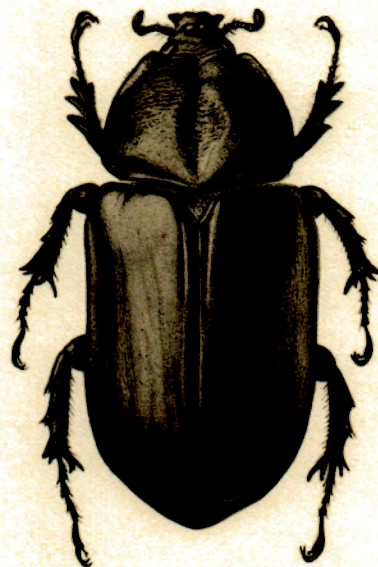
4.— Scapanes australis Boisduval ♀, × 1,5.

J. GILLET. — Coprinae, Hybosorinae, Dynastinae.