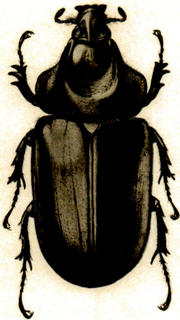
3.— Scapanes australis Boisduval ♂, × 1,5.