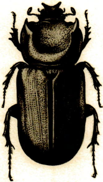
1.— Ceratoryctoderus Candezei Vollenhoven ♂, × 1,5.