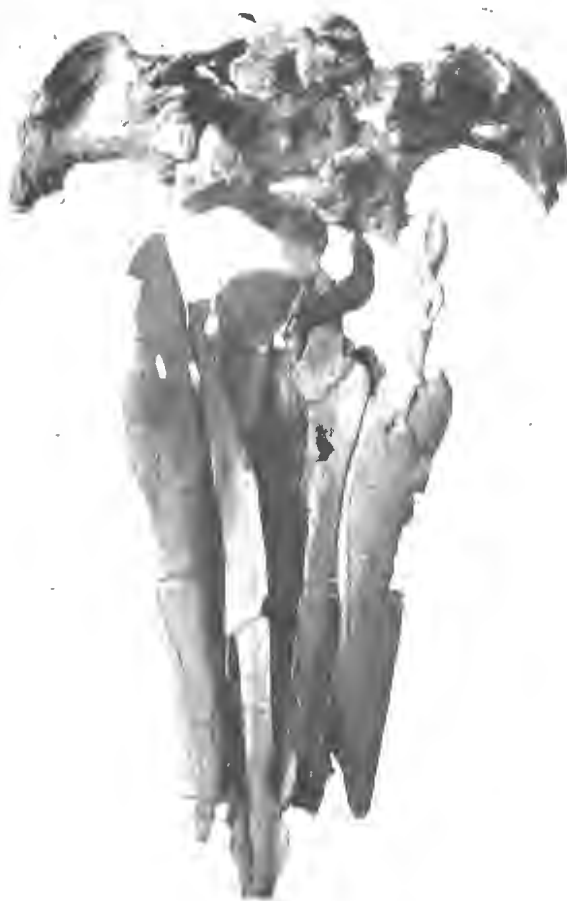
FIG. 5. — Scaldicetus Mortselensis , du Bus. — Miocène supérieur.

3. Delphinus Mortzeleensis . — E. L. TROUËSSART. Catalogus Mammalium , 1898, p. 1032.