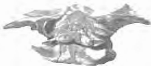
FIG. 2. — Scaldicetus Caretti , du Bus. — Miocène supérieur.

Pour montrer : l'Atlas libre, — les cinq vertèbres suivantes soudées, — la septième cervicale libre, — les neuf thoraciques antérieures portant des côtes bicipitales, — la dixième thoracique portant des côtes unicipitales, — comme chez Physeter macrocephalus .