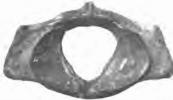
FIG. 6. — Scaldicetus Mortselensis , du Bus. — Miocène supérieur.

Il en est de même pour Hoplocetus minor (1) , Portis, de la Valle d'Andona (Asti) du Pliocène supérieur (d'après A. PORTIS, l. c. , p. 360). La figure de Brandt (2) est aussi insuffisante, pour se former un avis sur la différence entre Hoplocetus minor et Scaldicetus grandis , que les figures de l'ouvrage de A. Portis. Il me semble probable que la dent figurée par Brandt ( l. c. , Pl. V, Fig. 13) appartient à Scaldicetus grandis ; cependant il faudrait encore faire des recherches plus précises sur ce point.