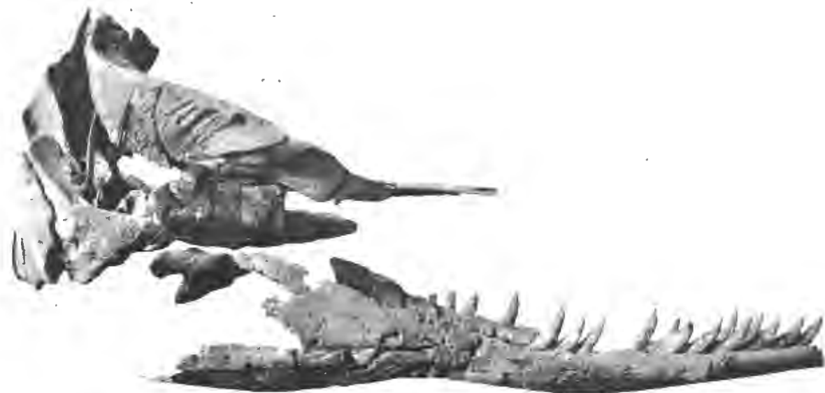
FIG. 11. — Physeterula Dubusii , P. J. Van Beneden. — Miocène supérieur.

8. Ziphius . — P. GERVAIS et P. J. VAN BENEDEN. Ostéographie , p. 518, Pl. XXI, Fig. 4-4a.