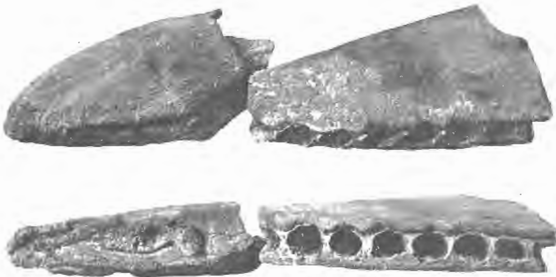
FIG. 13 et FIG. 14. — Prophyseter Dolloi , Abel. — Miocène supérieur.

Type : Extrémité antérieure du rostre (Musée de Bruxelles).