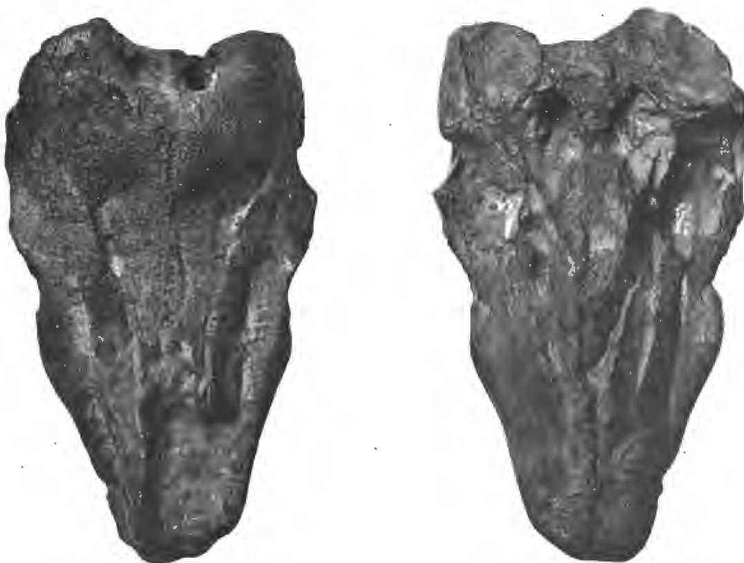
FIG. 22 et FIG. 23. — Protophocaena minima , Abel. — Miocène supérieur. Boldérien d'Anvers. — Crâne (région rostrale), vu de dessus (Fig. 22) et vu de dessous (Fig. 23). — Échelle : \frac{1}{4} .

Il est vrai qu'un grand nombre de genres fossiles de Cétacés ont été fondés sur des restes absolument insuffisants, ou, pour parler plus exactement, sur des restes qu'il était impossible de caractériser morphologiquement. On pourrait aussi fonder une série de genres et d'espèces sur les restes provenant du Boldérien, mais cette méthode de travail paléontologique a déjà produit un tel encombrement inutile de la bibliographie qu'il n'est plus permis de recommencer à créer ainsi des genres et des espèces factices.