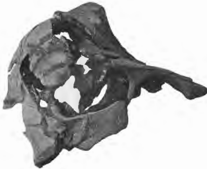
FIG. 24. — Pithanodelphis cornutus , du Bus. — Miocène supérieur.

Plus grand que Delphinus delphis . — Base du genre et de l'espèce. Crâne du Phocænopsis cornutus , du Bus. — Profil du crâne semblable à Phocæna , mais arcade sus-orbitaire très fortement convexe. — Les susmaxillaires s'étendant très haut sur le crâne, se glissant derrière les nasaux, en forme de coin, sur la ligne médiane, ne laissant libre entre eux qu'une très petite partie des frontaux. — Nasaux, très grands, peu asymétriques, séparés dans la moitié postérieure par un coin étroit, formé par les frontaux. — Prémaxillaires s'étendant jusqu'à la moitié de la longueur du bord extérieur des frontaux. — Fosse temporale, grande; apophyse post-orbitaire touchant presque l'apophyse zygomatique. — Apophyse paroccipitale, grande, engainante, entourant la bulla. — Squamosal, grand. — Apophyse préorbitaire, fort saillante. — Atlas et axis presque toujours soudés, séparés seulement dans un seul exemplaire. — Vertèbres un peu plus longues que chez Delphinus . — Apophyses transverses des vertèbres lombaires, droites, non épanouies, mais à peu près de même largeur et rétrécies seulement aux extrémités.