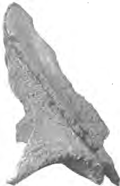
FIG. 8. — Thalassocetus Antwerpiensis , Abel. — Miocène supérieur.

Boldérien d'Anvers. — Aile sus-orbitaire droite, vue de côté. — Echelle : \frac{1}{5} .