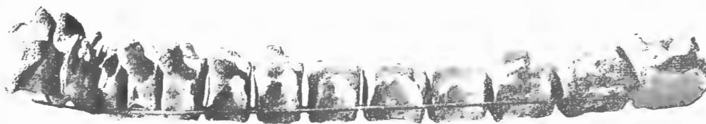
FIG. 1. — Scaldicetus Caretti , du Bus. — Miocène supérieur.

Type de l' Homæocetus Villersii , du Bus.