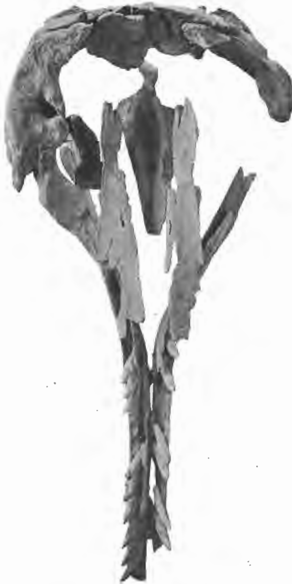
FIG. 12. — Physeterula Dubusii , P. J. Van Beneden. — Miocène supérieur.

Original du Physeterula Dubusii (P. J. VAN BENEDEN. Bull. Acad. Belg. , 46 e année, 2 e série, XLIV, 1877, pp. 851-856, Pl. I).