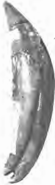
FIG. 3. — Scaldicetus grandis , du Bus. — Miocène supérieur.

5. Palæodelphis grandis . — B. DU BUS. Mammifères nouveaux du Crag d'Anvers . BULL. ACAD. BELG., 41 e année, 2 e série, XXXIV, 1872, p. 503. — P. GERVAIS et P. J. VAN BENEDEN. Ostéographie , p. 336, Pl. XX, Fig. 21 (non pas Fig. 24, comme il est indiqué dans le texte, p. 336!).