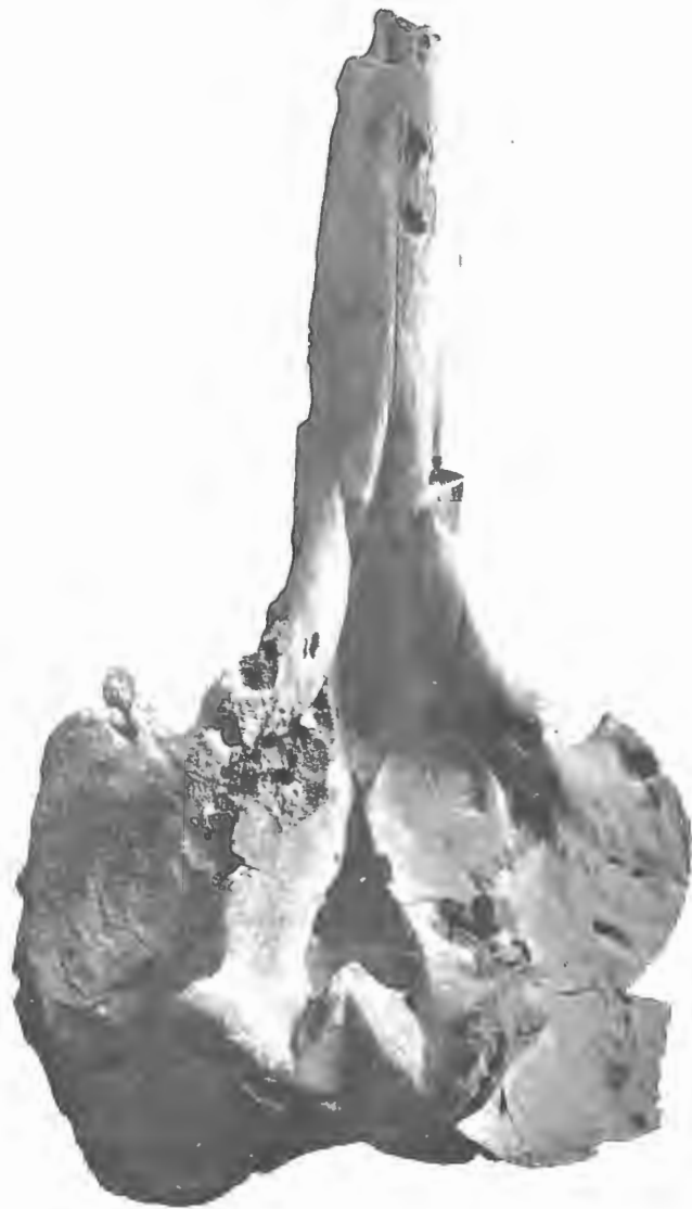
FIG. 17. — Mioziphius belgicus , Abel. — Miocène supérieur.

Boldérien d'Anvers. — Crâne, vu de dessus. — Echelle : \frac{1}{4} .