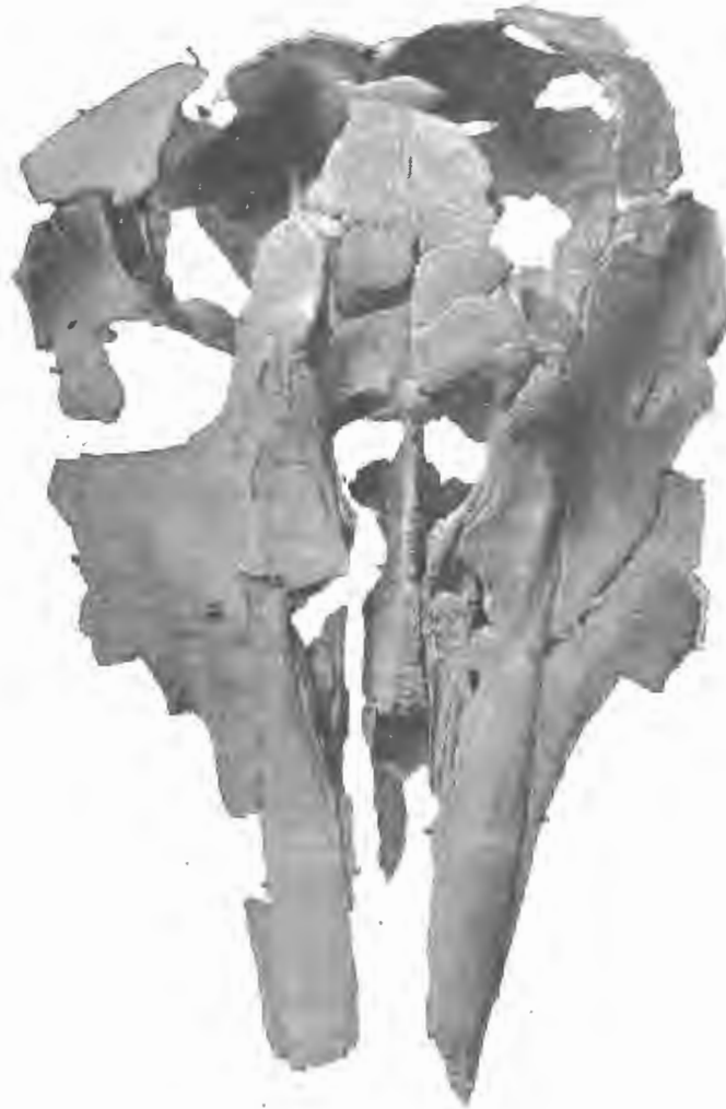
FIG. 21. — Acrodelphis Scheynensis , du Bus. — Miocène supérieur.

Couronne, portant une grande dentelure sur le bord postérieur, dentelure sur laquelle s'en trouvent plusieurs plus petites, — carénée derrière et devant, émoussée