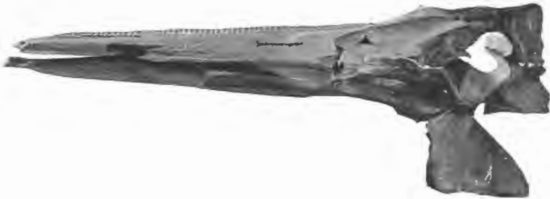
FIG. 18. — Mioziphius belgicus , Abel. — Miocène supérieur.

Comme, par conséquent, aucune de ces diagnoses ne tient compte des importants caractères morphologiques de cette forme, dans leur ensemble, et que, en outre, l'original de Van Beneden n'est pas reconnaissable, parce que la diagnose de cet auteur ne suffit pas pour le reconnaître, — on doit supprimer les genres Ziphrostrum , Aporotus et Ziphiopsis , ainsi que le genre Synostodon , du Bus, nom. nud., et les remplacer par un nouveau nom de genre, pour lequel je propose le terme Mioziphius .