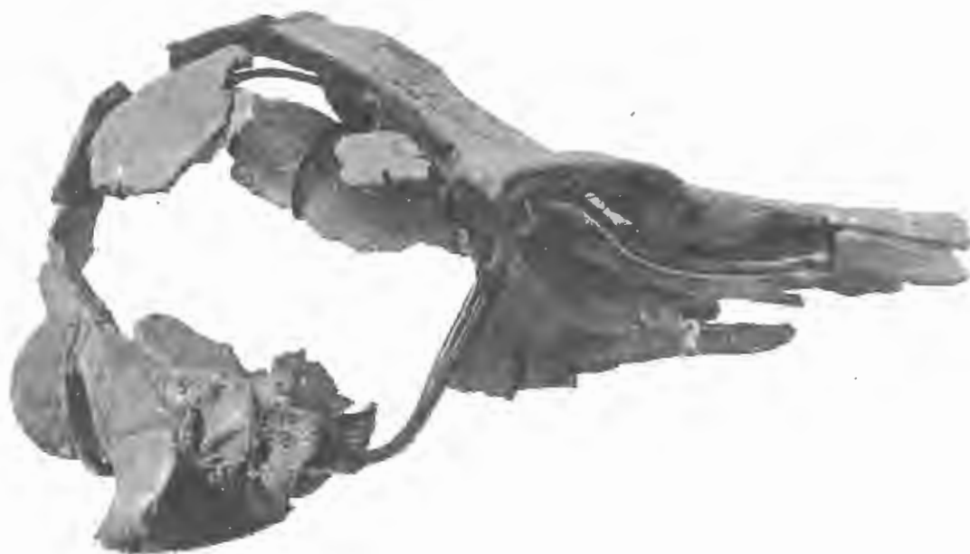
FIG. 20. — Acrodelphis Scheynensis , du Bus. — Miocène supérieur.

Type : Trois dents de la molasse de Baltringen. — J. PROBST. Württemberg. Jahresh. , 42. Jahrg., Stuttgart, 1886, p. 124, Pl. III, Fig. 18-21 ( Champsodelphis denticulatus , Probst) et deux autres, de même provenance, l. c. , p. 126, Pl. III, Fig. 22-23 ( Champsodelphis cristatus , Probst).