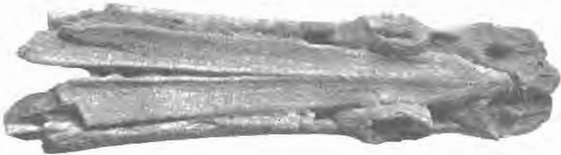
FIG. 19. — Mioziphius belgicus , Abel. — Miocène supérieur.

9. Aporotus affinis . — B. DU BUS, l. c. , 1868, p. 626; P. GERVAIS et P. J. VAN BENEDEN. Ostéographie , p. 416 (L'original d' Aporotus affinis , n° 3819 du Catalogue du Musée de Bruxelles, porte l'étiquette écrite par du Bus : Ziphrostrum affine ).