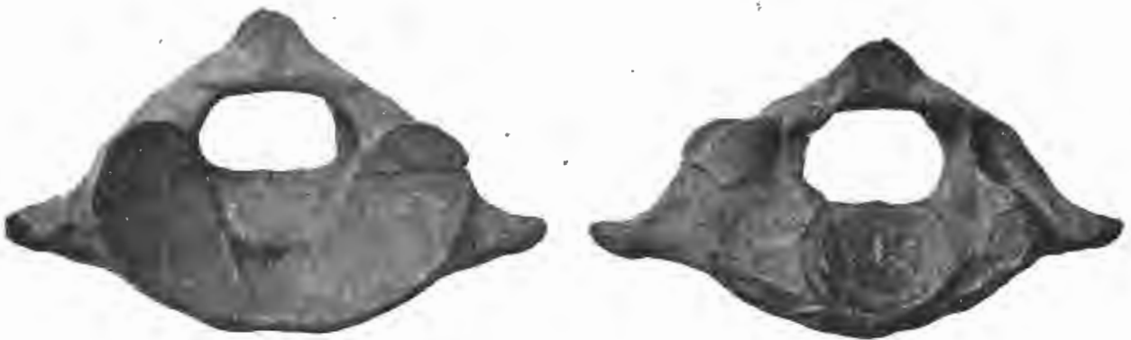
FIG. 26 et FIG. 27. — Pithanodelphis cornutus , du Bus. — Miocène supérieur.

Pour montrer : le susmaxillaire débordant loin en arrière des nasaux, vers la ligne médiane, — les nasaux séparés, sur la ligne médiane, dans leur moitié postérieure, par un coin constitué par les frontaux, — l'apophyse préorbitaire fort saillante, — les nasaux, grands, peu asymétriques.