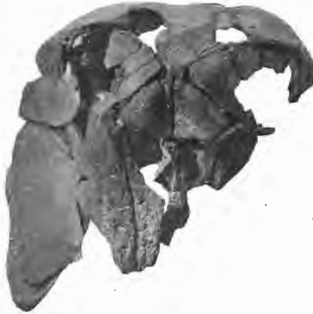
FIG. 25. — Pithanodelphis cornutus , du Bus. — Miocène supérieur.

Original de Phocænopsis cornutus , du Bus.