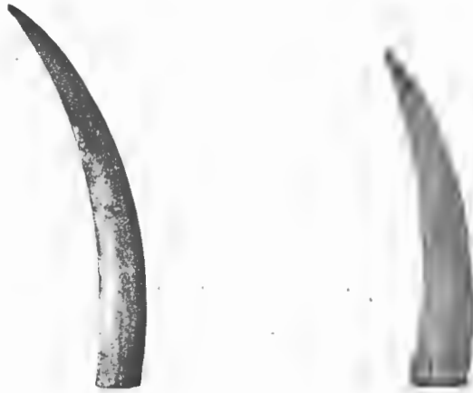
FIG. 9 ET 10. — Dents de Physétérides (gen. indet.). — Miocène supérieur.

Thalassocetus Antwerpiensis a ses plus proches parents parmi les espèces de Scaldicetus du Boldérien d'Anvers.