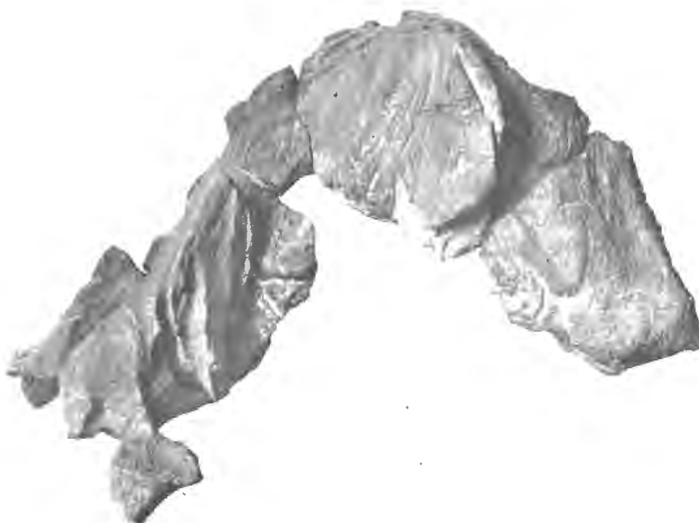
FIG. 7. — Thalassocetus Antwerpiensis , Abel. — Miocène supérieur.

Extrémité supérieure du prémaxillaire conformée comme chez Kogia. Les os de la moitié