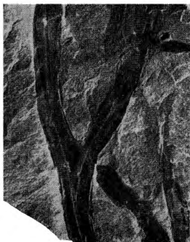
Fig. 2. — Tæniocrada Langi nov. sp. Un axe bifurqué avec un corps ovoïde en place. Grandeur naturelle. Provenance : Estinnes-au-Mont.

Empreintes rubanées, à bords parallèles, rarement ramifiées, de largeur assez constante oscillant autour de 5 à 7 millimètres.