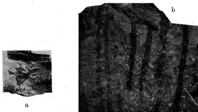
Fig. 1. — Protolepidodendron wahnbachense Kr. et Weyl. a, faux verticille de feuilles; b, axes feuillés. Grandeur naturelle. Provenance : Estinnes-au-Mont.