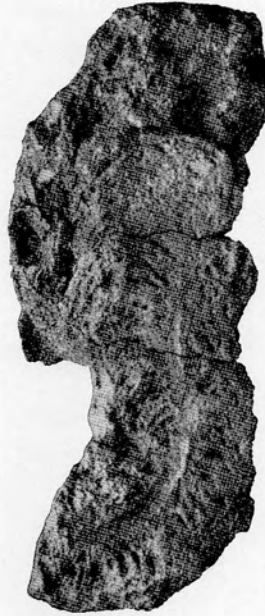
Terrier d'Annélide. — Grandeur naturelle.

Age: Panisélien (Eocène moyen). — Localité: Quaremont (Flandre Orientale). — Musée royal d'Histoire naturelle. Collection E. Delvaux, n° 6852.