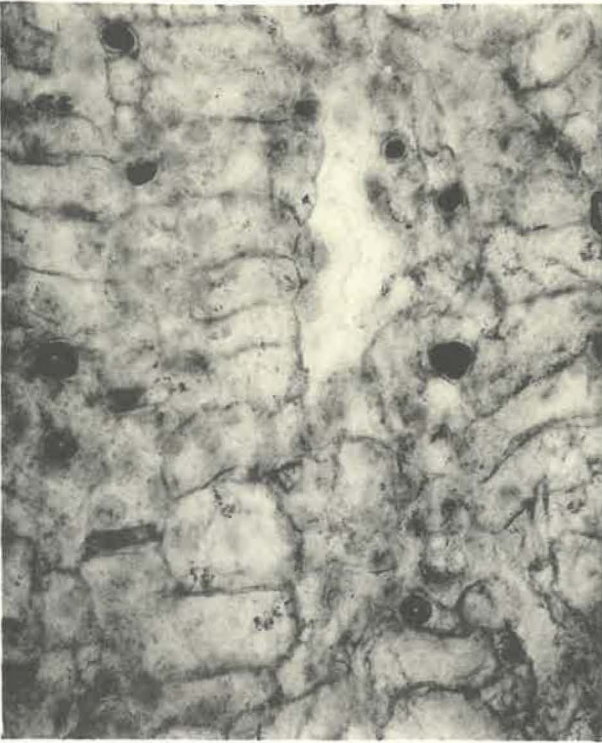
3 (x 110)