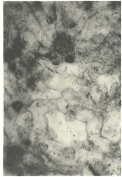
4 (x 110)