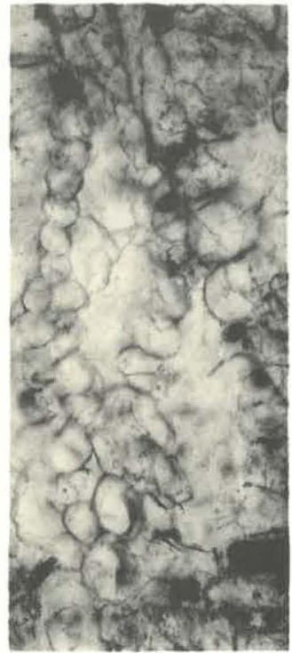
2 (x 110)