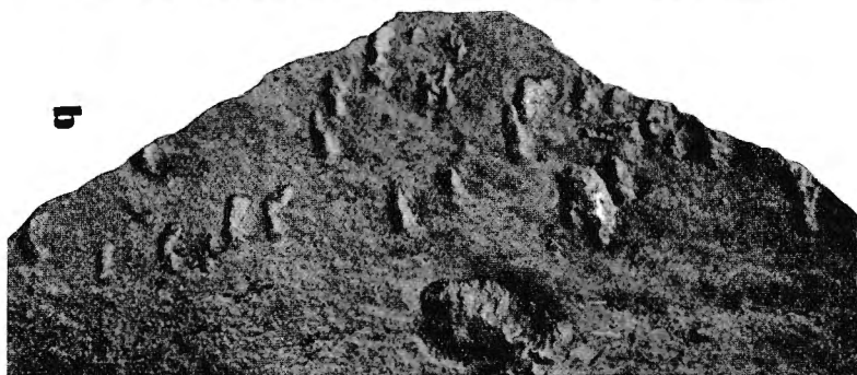
Fig. a. — Empreintes de gouttes de pluie.

Fig. b. — ? Traces de la marche d'un animal (Arthropode?).