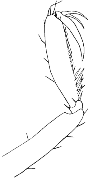
Fig. 1. — Pallene phantoma DOHRN, Propode de la patte IV.

Pallene phantoma DOHRN est donc assez largement répandu et moins sténobathe que l'on aurait pu le croire d'après les premiers renseignements publiés à son sujet.