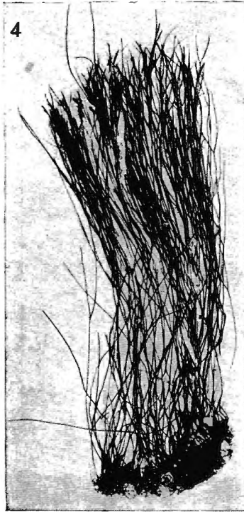
Aglaophenia (?) holubi nov. sp.

— Hydrocaules : minces, brunâtres, réunis en touffes, monosiphoniques, simples ou peu ramifiés dichotomiquement ; composés d'articles courts, à péricône épais, presque aussi hauts que larges, séparés par des annelations obliques, avec apophyses courtes, obliques de bas en haut, alternes, pourvues d'une nématothèque, portant hydroclade ; pour autant que l'examen en soit possible, deux nématothèques caulinaires, médianes, une sous l'apophyse et une au-dessus, courtes, larges.