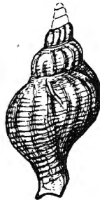
Fig. 4. — Siphonalia marescensis nov. sp. Loc. : Orp-le-Grand ( \times 1/2 ).

Coquille assez grande, bucciniforme. Tours au nombre de six à sept, arrondis, très convexes, séparés par une suture enfoncée, couverts de cordonnets spiraux et de côtes arrondies, arquées, au nombre de quatorze environ par tour, passant d'une suture à l'autre, séparées par des intervalles concaves. Dernier tour plus long que la spire ; mesuré au dos il égale les trois cinquièmes de la longueur totale de la coquille ; il est convexe, ventru, se contracte rapidement en un canal court et contourné. Ses côtes sont obliques, sinueuses, tendent à disparaître avec l'âge, et s'effacent vers la naissance du canal, il porte également des cordonnets spiraux assez larges, séparés par des intervalles étroits, mais s'élargissant sur la région antérieure du tour,