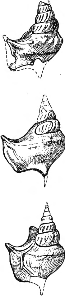
Fig. 2. — Arrhoges marescensis nov. sp. ( \times 2 ).

Très voisin de A. triangula , Gardner, des couches d'Oldhaven,