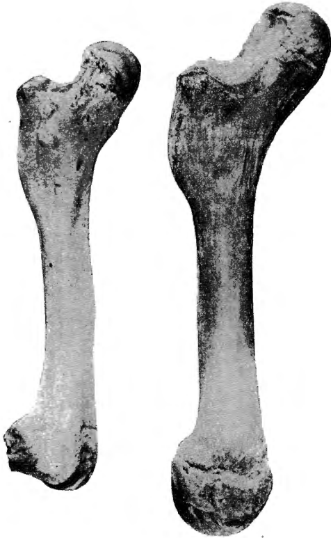
Fig. 1. — Fémurs de Varanus salvator (LAUR.) et de Varanus komodoensis OUWENS, pour montrer le développement du trochanter interne (gross. \times 2/3 ).

S'il en est réellement ainsi, il ne serait pas étonnant de pouvoir interpréter la fusion de la 3 e et de la 4 e vertèbre caudale,