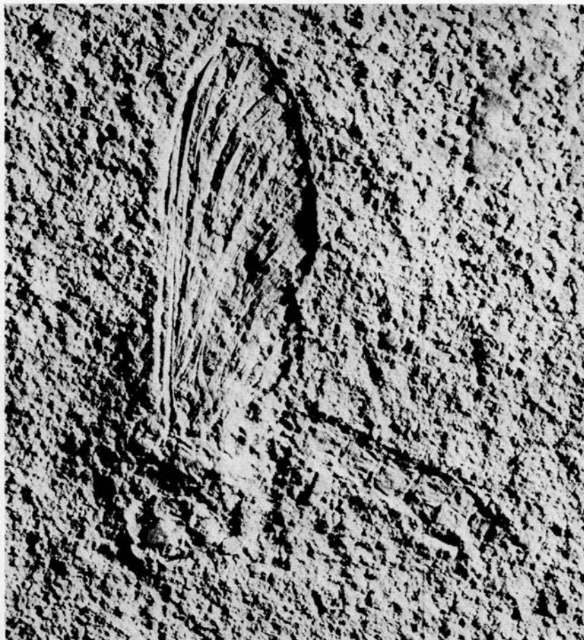
Hexagenites cellulosus (HAGEN) ♀ (Holotype de Paedephemera multinervosa (OPPENHEIM) in Bayer. Staatssamml. Pal. & hist. Geol., München). Vue générale de l'empreinte; \times 3,6 env. L'insecte se présente en vue latérale gauche.

G. DEMOULIN. — Contribution à l'étude morphologique, systématique et phylogénique des Ephéméroptères jurassiques d'Europe centrale.