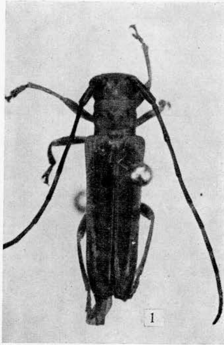
Fig. 1. — Nupserha malabarensis Pic m. bivittipennis nov.