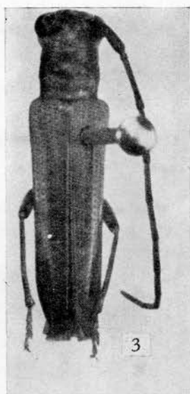
Fig. 3. — Nupserha madurensis PIC m. nigrobivittipennis nov.

Type. — Un ♂ de l'Inde : Nilghiri Hills, Devala, 1.100 m alt., V-1961, leg. N. S. NATHAN in coll. GILMOUR.