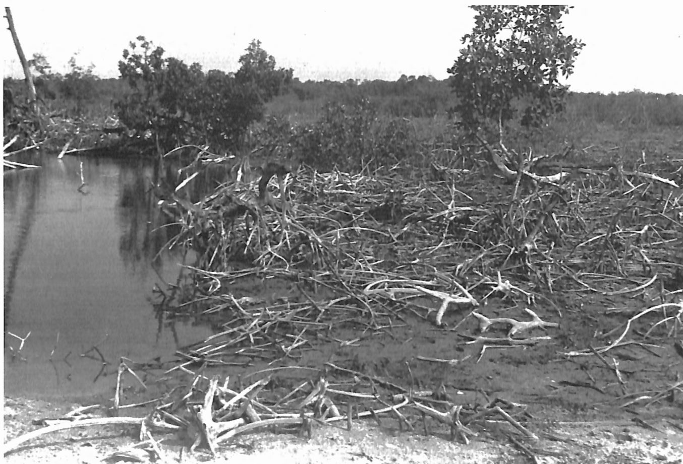
Fig. 2. Aspect typique de la Mangrove à palétuviers, en dégradation, avec évolution vers la formation de "tanne". Entre Oussouye et Cap Skirring.

Comme c'est le cas presque partout en Afrique, plus aucun grand mammifère n'est observé le long des grands axes routiers. On note d'assez nombreux rats-palmistes, Euxerus erythropus ; leur réflexe de traversée de la route, devant le véhicule est typique. On les observe autant dans les milieux xérophiles que dans les forêts (Basse Casamance).