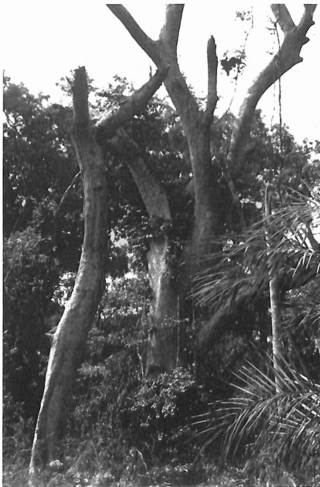
Fig. 3. Détérioration de la forêt de Basse Casamance, avec assèchement et mort des grandes essences forestières ( Parinari ).

Sur les plages, on note d'assez nombreux Vautours Nesocrytes , qui parasitent les villages de pêcheurs ; il n'y