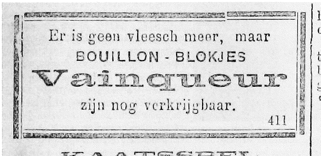
Figuur 1: Ietwat cynische reclame uit de Aalsterse 'De Volksstem' van 06.05.1916.

aangevuld door wat stroperij op konijn, kat en zangvogels. Daarnaast is de visconsumptie niet onbelangrijk. Op de Aalsterse tafel verscheen een divers gamma van kleine zoetwatervissen (vooral karperachtigen) of kleine vertegenwoordigers van doorgaans grotere soorten (paling) maar de aanvoer van zeevis was in gewicht belangrijker. Het gaat om vangsten uit de kustwateren met vooral haring en misschien ook sprot. Schelvis werd wellicht in gedroogde vorm (als een soort stokvis) aangevoerd. Mossels, alikruik en garnalen zorgden voor wat afwisseling op het menu.