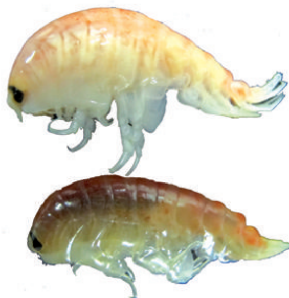
Abyssorchomene rossi .