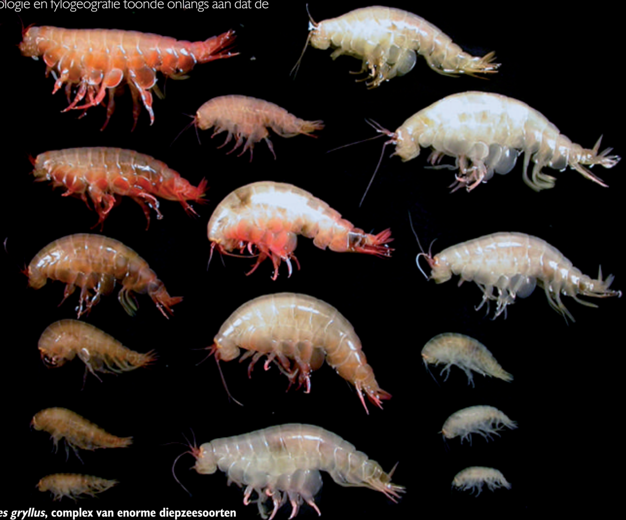
Fig. 2 Eurythenes gryllus , complex van enorme diepzeesoorten.

Deze initiële onderzoeken naar een specifieke groep amfipoden zijn intussen uitgebreid naar verschillende andere groepen, waaronder enkele iconische exemplaren van de Antarctische fauna (fig. 3). Ze bevestigen stuk voor stuk een fundamenteel gelijklopend scenario. Er is sprake van een mix van wijd verspreide soorten en soorten met een beperkte verspreiding, de meeste endemisch voor Antarctica of de Zuidelijke IJsee, soms met een grote fractie cryptische diversiteit; de soortenrijkdom werd in ieder geval sterk onderschat. De kennis van de verspreiding over de biogeografische gebieden, de bathymetrische zones, de habitats en de ecofunctionele groepen van deze soorten, blijft beperkt.