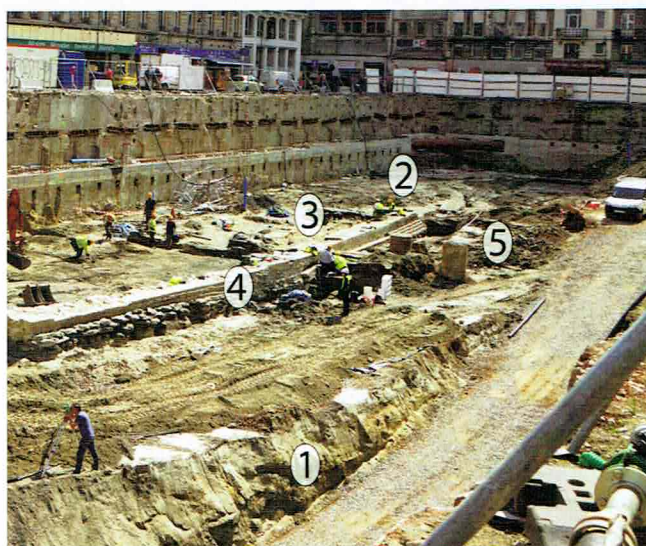
Fig.1 : Vue du chantier de la moitié sud du chantier. 1 : Niveaux pré-holocènes / 2 : Anciens lits de Senne viii-xii e siècle / 3. Berges xiii-xiv e siècle / 4. Quai xiv-xix e siècle / 5. Senne canalisée xiv-xv e siècle.

On ne peut s'empêcher de faire le lien entre ces aménagements de berges fixant le cours de la Senne et la construction de la première enceinte urbaine, datée du xiii e siècle, dont 2 portes encadrent la sortie du cours d'eau à quelques dizaines de mètres au nord du chantier, les deux chantiers s'intégrant dans la dynamique de développement du quartier portuaire.