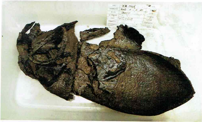
Fig.2 : Chaussure en cuir (probablement XIII e siècle) © urban.brussels.

jusqu'à son voûtement en 1867-1871, les constructions faisant suite à ces aménagements -Halles centrales (1872-1874) et Parking 58- ont déjà bien entamé le terrain. Les conditions très favorables de conservation du matériel en milieu anaérobie et son abondance nous ont toutefois permis de prélever un large panel d'objets qui nous renseignent sur le mode de vie de l'époque, les activités en rivière et aux abords de celle-ci.