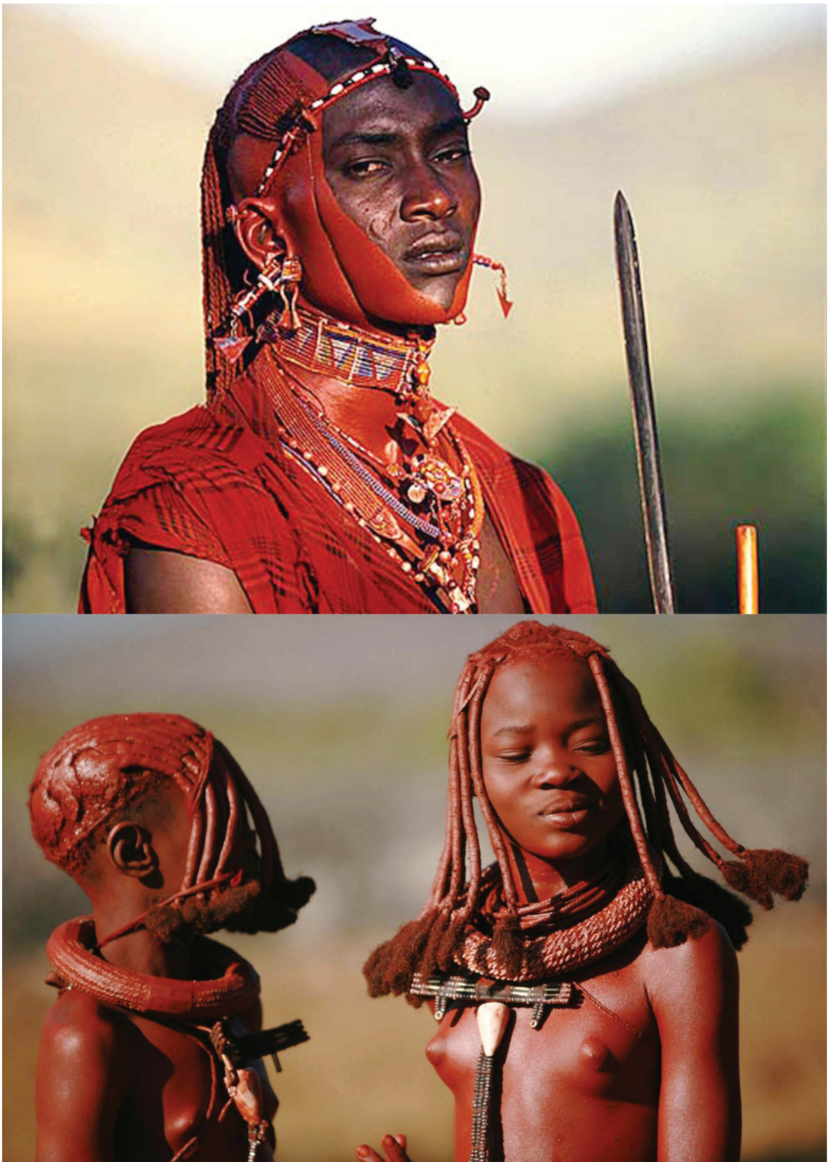
Fig. 3 – Le rouge foncé est la couleur de la force (haut) ; le vermillon est la couleur de la vie, du renouveau (bas), d'après Iten, 1983.