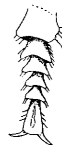
Fig. 1. sinistro dello Stereostoma hirtipenne MÜLLER subsp. Basilewskyi nov.; tarso posteriore.

1°) limitarsi ai punti del labbro, che diventano due soli, mentre si conservano i pori setigeri all'apice e spesso anche alla base delle interstrie dispari, avendosi così la forma senegalense MÜLLER; del Congo Belga ho veduto due esemplari di Kivu, uno di