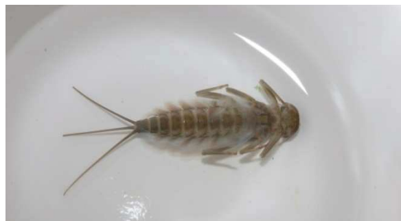
Fig. 2. R. germanica , larve.