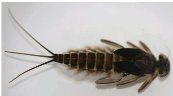
Fig. 1. R. germanica , larve.

Seule la branchie I est festonnée ou échancrée. Tête noire, brunâtre au-dessus. Ocelles et antennes jaunâtres. Thorax brun de poix avec une étroite strie médiane jaunâtre. Fourreaux alaires bruns de poix. Dessous du thorax jaunâtre. Coloration de la face dorsale du corps relativement uniforme et sombre: brun foncé à brun olivâtre, plus claire sur la face ventrale. Tergites de l'abdomen uniformément brun foncé à noirâtre au-dessus; sur chacun des segments une fine striole noirâtre et parallèle au bord postérieur. 1 er , 2 ème et parfois 9 ème tergites de l'abdomen plus clairs. Face dorsale des fémurs brunâtre sauf sur la zone claire centrale (assez étroite) et un petit éclaircissement distal. Tache foncée, au centre de la zone claire, large et diffuse, colorée d'un violet noir ou violet rouge. Cerques un peu plus courts que le corps, subégaux, bruns à brun clair avec des intersections jaunâtres et l'extrémité jaunâtre également.