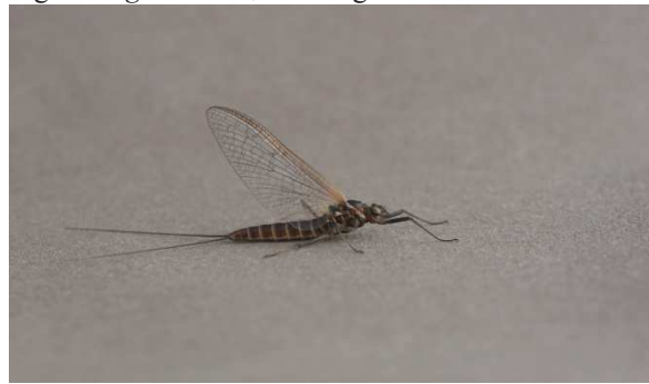
Fig. 6. R. germanica , imago femelle.