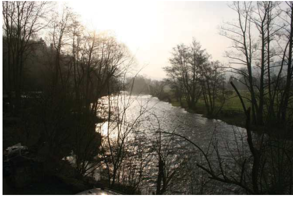
Fig. 8. L'Ourthe entre Hampteau et Hotton, au milieu de la zone couverte.