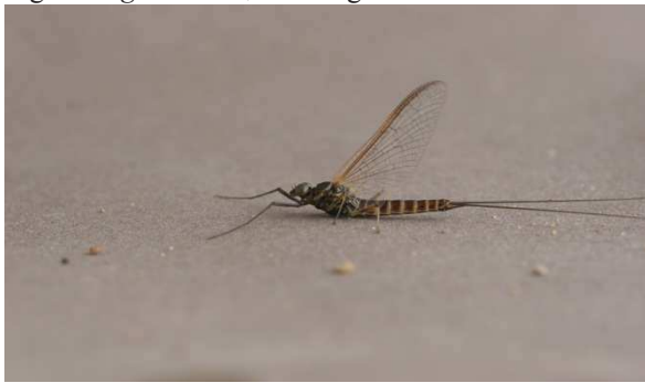
Fig. 5. R. germanica , imago mâle.