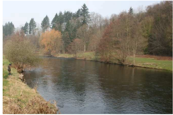
Fig. 9. Zone d'éclosion typique de R. germanica , zone calme en aval d'un courant soutenu.