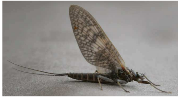
Fig. 4. R. germanica , subimago femelle.