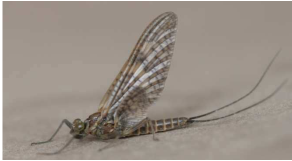
Fig. 3. R. germanica , subimago mâle.