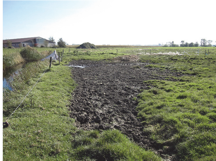
Fig. 1. Malaiseval langs een brakke sloot in de Jeronimuspolder te Sint-Laureins