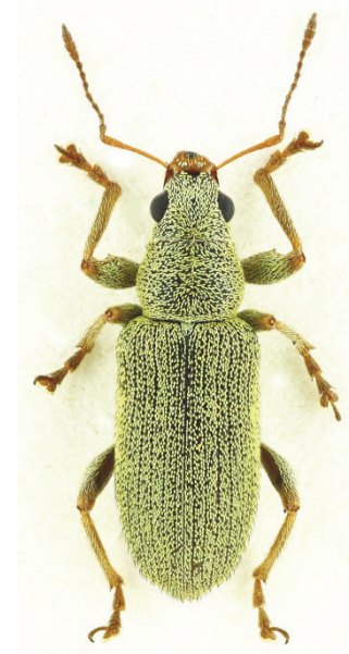
Habitus de Pachyrhinus lethierryi (Clos Tom et Jerry, Bruxelles, 27.V.2013).