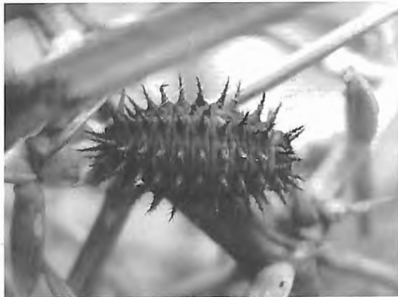
Fig. 3 : Chilocorus renipustulatus – larve (14.VI.2009) – le premier segment abdominal n'est pas de couleur claire.