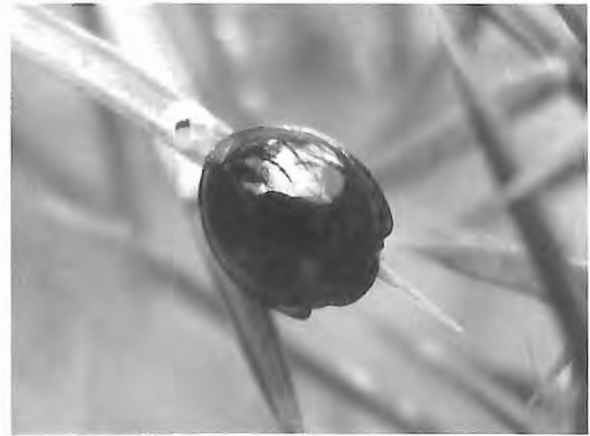
Fig. 6 : Chilocorus renipustulatus – imago (12.VII.2009) - les élytres, très brillants, présentent chacun une tache rouge et ronde.