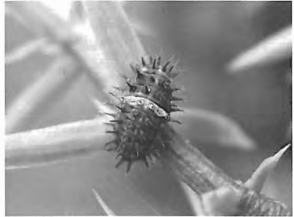
Fig. 4 : Chilocorus bipustulatus – larve (23.VIII.2009) – le premier segment abdominal clair est bien visible.