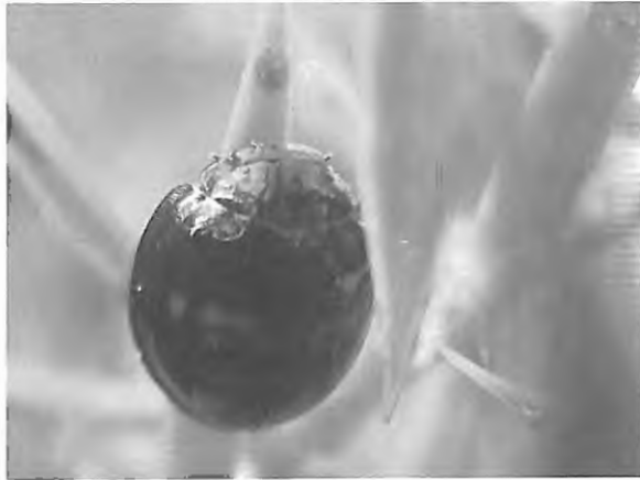
Fig. 1 : Chilocorus bipustulatus (27.IX.2009) - une cochenille est bien visible au bout de l'aiguille sur laquelle la coccinelle se tient.