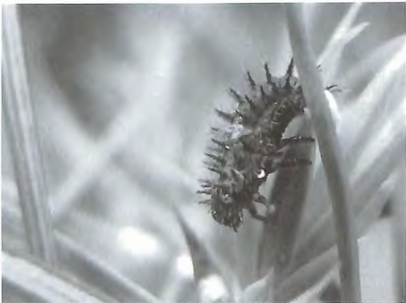
Fig. 11 : Chilocorus bipustulatus – larve (13.VI.2010).