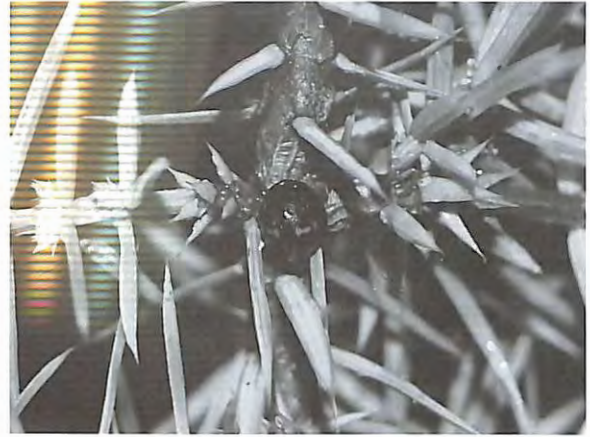
Fig. 8 : Chilocorus bipustulatus – imago en diapause (23.I.2010)