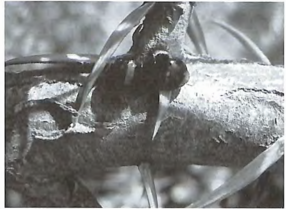
Fig. 10 : Chilocorus bipustulatus – poursuite et prélude à l'accouplement (15.IV.2010)