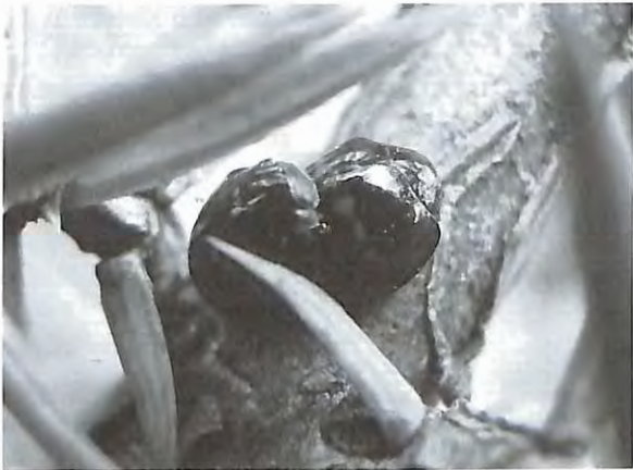
Fig. 9 : Chilocorus bipustulatus – accouplement (27.III.2010)