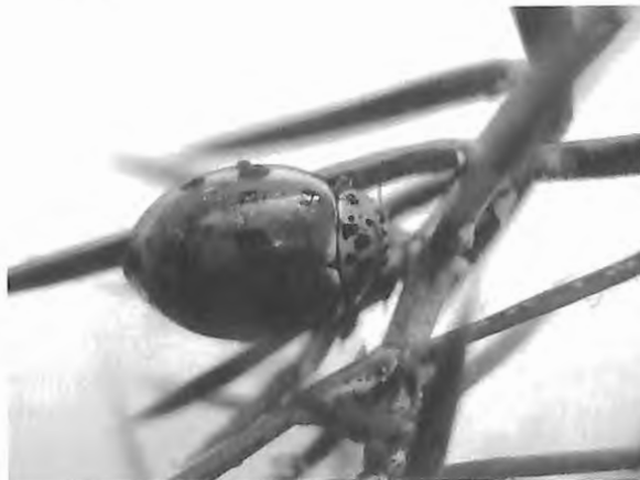
Fig. 5 : Harmonia quadripunctata – imago (1.VII.2009)