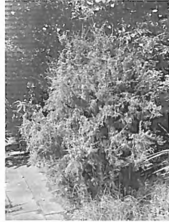
Fig. 2 : Le genévrier commun abritant la population de C. bipustulatus