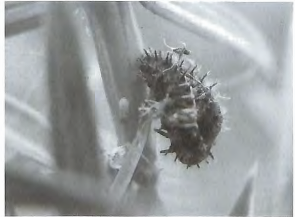
Fig. 12 : Chilocorus bipustulatus – chrysalide (1.VIII.2010)