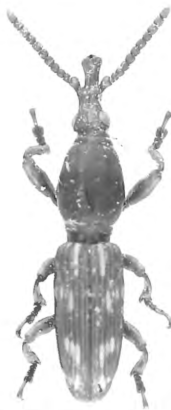
Fig. 1. Baryrhynchus smetsi sp. n., habitus, vue dorsale.

Tête: largeur à la base égale à sa longueur, base concave avec un sillon longitudinal peu profond s'élargissant sur le métarostre; tempes très courtes, yeux grands et ronds; devant les yeux, deux pores sensoriels placés de part et d'autre d'un axe horizontal; sur le métarostre deux carènes latérales joignant les yeux au mésorostre; sur la face ventrale de la tête et du métarostre, deux rangées de 4 pores partant du dessous de la tête près des yeux et se terminant à l'apex du métarostre, deux pores à la base du métarostre; mésorostre élargi par deux protubérances à l'insertion des antennes; prorostre avec des carènes latérales débutant à sa base et s'estompant au début de l'élargissement apical; mandibules normales; antennes atteignant le premier tiers du prothorax; scape gros, un peu