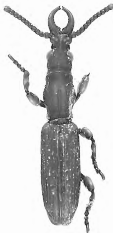
Fig. 3. Leptamorphocephalus constanti sp. n., habitus, vue dorsale.

Pattes: peu épaissies; les pédoncules et les