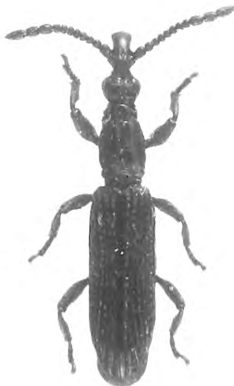
Fig. 5. Stereodermus papuanus sp. n., habitus, vue dorsale.

Etymologie: Tout le corps est noir, le prothorax