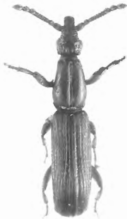
Fig. 8. Higonius nitens sp. n., habitus, vue dorsale.

Dans la clé de détermination des Ithystenus de R. Kleine 1919, la forme des lamelles des paramères placerait I. limbourgi sp. n. dans le groupe 2 ( I. frontalis Pascoe). Cette espèce se distingue par sa coloration presque noire et la présence de macules élytrales, la forme plus élargie