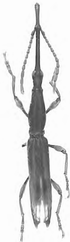
Fig. 7. Ithystenus limbourgi sp. n., habitus, vue dorsale.

Thorax: prothorax allongé, base avec un bourrelet transversal suivi d'un rétrécissement sur le premier quart; la partie inférieure des côtés marquée de gros points; pronotum profondément sillonné; bord collaire épais.