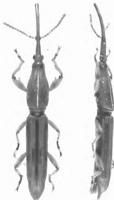
Fig. 9. Hormocerus snizeki sp. n., habitus, vue dorsale et vue latérale.

Tête: transverse, nettement séparée du cou; base droite, élargie derrière les yeux, avec une entaille médiane n'atteignant pas le vertex; yeux grands, un peu orientés vers l'avant; entre les yeux, une fovéole qui se prolonge sur le métarostre jusqu'à la base du mésorostre; sous le métarostre une série de poils distincts dressés; mésorostre faiblement élargi; prorostré long comme le double du métarostre, fin et cylindrique, indistinctement élargi à l'apex, courbé vers le bas; les antennes atteignant le quart apical du prothorax; scape long et légèrement élargi à l'apex; article 2 conique; article 3 conique et plus long que 2; articles 4 à