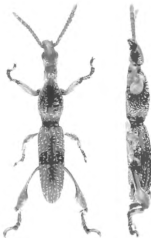
Fig. 4. Cyphagogus hirsutus sp. n., habitus, vue dorsale et vue latérale.

Pattes: fémurs antérieurs et médians à massue verticalement élargie au milieu et à pédoncules très courts; fémurs postérieurs à pédoncule long, lamelliforme et courbé vers l'intérieur, avec les arêtes supérieure et inférieure finement pileuses, massues bombées dans la première moitié et concave dans la seconde moitié, l'arête supérieure restant épaisse et couverte de poils épais; tibias normaux et fortement pileux; métatarses postérieurs de longueur égale à celle des deux articles suivants réunis; tous les tarses pileux; onychiums