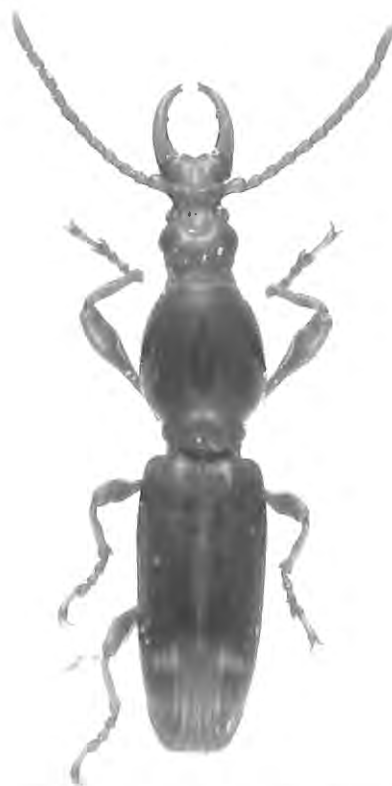
Fig. 2. Orfilaia jakli sp.n., habitus, vue dorsale.

O. jakli sp. n. est très proche de O. erythrea De Muizon. Celui-ci se différencie par sa situation géographique (africaine), par sa coloration noirâtre, les macules élytrales plus longues et plus nombreuses, le prothorax brillant, le crénelage de la base du prothorax moins serré.