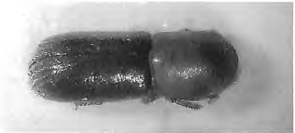
Photo d'une femelle de Xyleborus peregrinus .