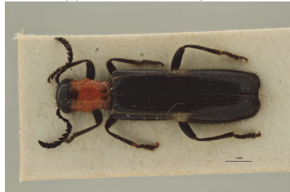
Fig. 4. Tillus elongatus (Linnaeus, 1758), ♀. Forma hyalinus Sturm. Torgny (LX), 13.VI.1956 (Coll. E. Derenne).