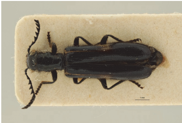
Fig. 3. Tillus elongatus (Linnaeus, 1758), ♂. Forma hyalinus Sturm. Rixensart (BW), 21.VI.1976 (Coll. J. Leroux).