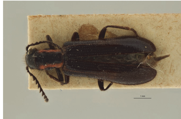
Fig. 2. Tillus elongatus (Linnaeus, 1758), ♂. Kleuraberratie. Bosvoorde (HGB), 7.VI.1917 (Coll. Guillaume).