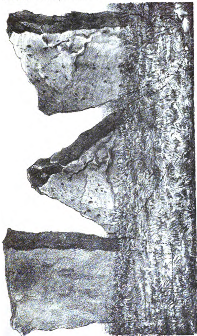
D.A. VAN BASTELAER, TROIS MENHIRS.