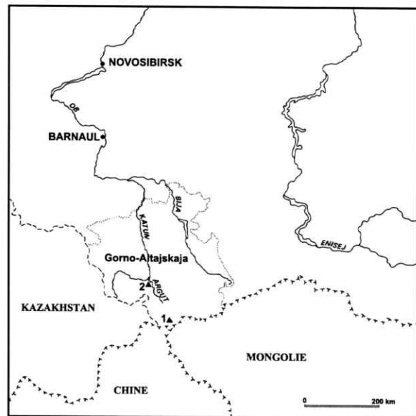
Fig. 1 — Situation des sites fouillés en 1992 et 1993 sur le plateau d'Ukok (1) et en 1995 dans le massif de la Beloucha (2).

Les sites fouillés se situent à une altitude de quelque 2000 m, sur des plateaux encore occupés aujourd'hui comme aux derniers siècles avant