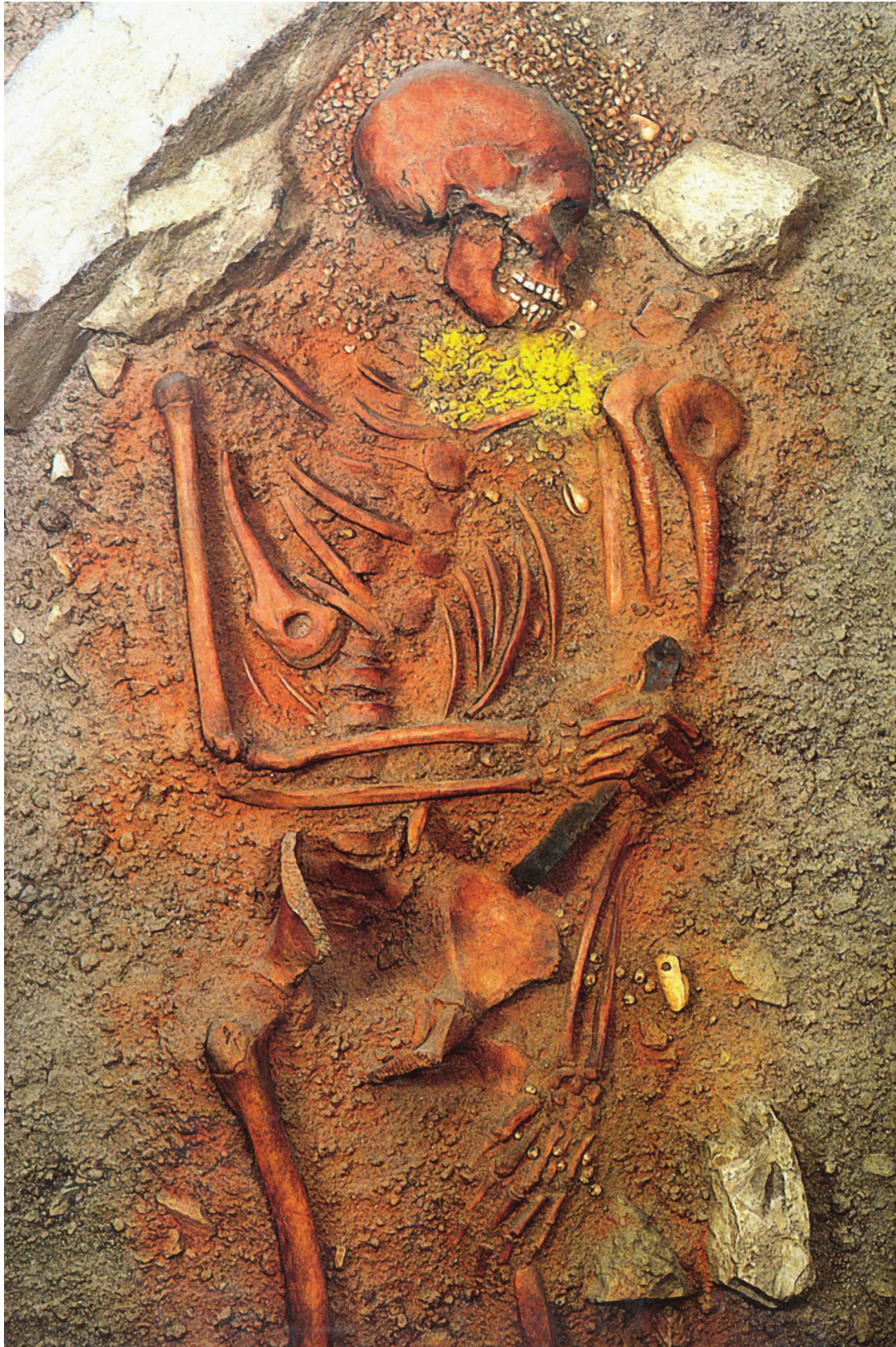
Fig. 1 - Sépulture gravettienne des Arenes Candide . L'ocre, la vie et la mort se trouvent symboliquement associés (d'après Henry-Gambier, 2003).