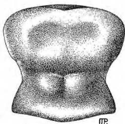
FIG. 3. — Pronotum de Paussus Burgeoni n. ssp. lucidus .

Dans le genre Paussus , il semble à première vue que l'on doive relever aussi la présence d'une espèce septentrionale : P. Woerdeni Ritsema. Jusqu'à présent, la dispersion de cette espèce était fort limitée : on ne la trouvait guère que dans la cuvette, spécialement dans le Bas-Congo. Comme il est