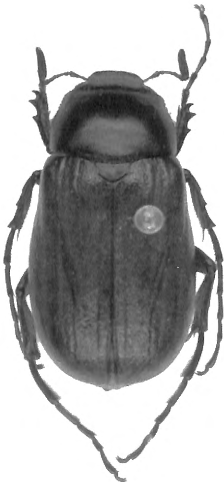
Fig. 13 — Siamophylla grootaerti nov. gen., nov. sp., habitus.

A: Protibia; B: Rapport de la longueur de la massue du mâle et du funicule; C: Dernier article du palpe maxillaire; D: Dessus et ventrites; E: Abdomen du mâle; F: Tâches latérales de pubescence sur les ventrites; G: Métatarses I et II; H: Clypeus; I: Ongles; J: Mésotarses I et II; K: Genitalia; L: Répartition