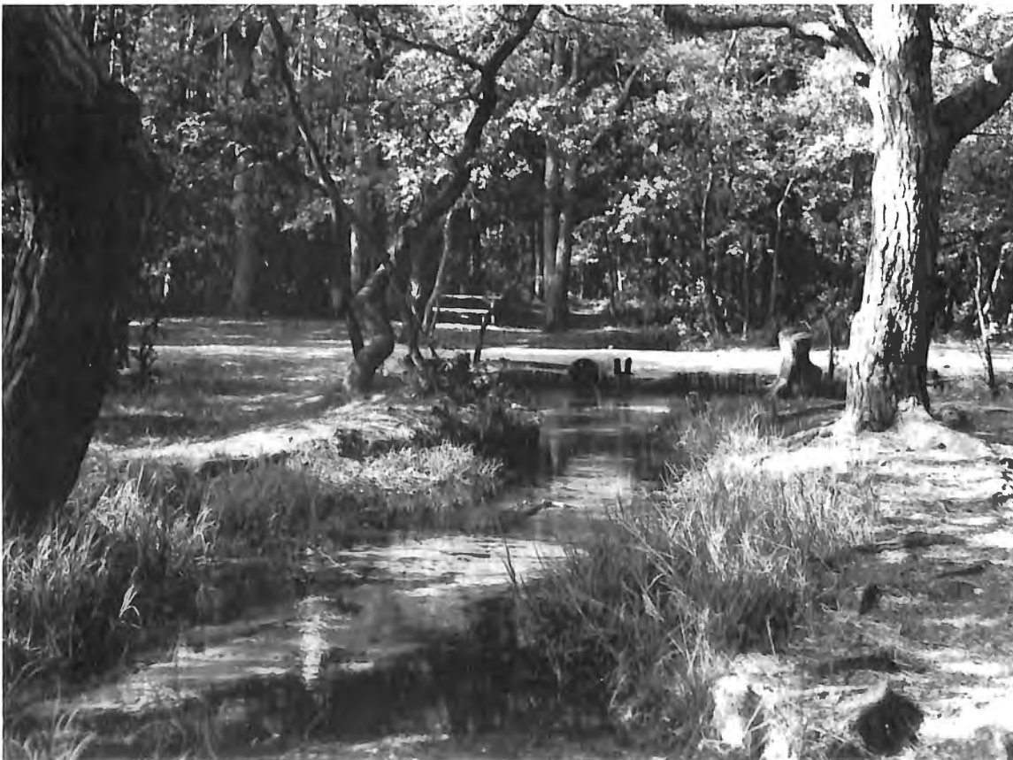
Fig. 3 : Station d'échantillonnage de M. tinctus en Campine : le Ziepbeek à Zutendaal-Rekem.

Quoiqu'il en soit, bien qu'il faille considérer de telles hypothèses avec prudence, M. tinctus est certainement intéressant au point de vue écologique. Il conviendrait sans doute d'approfondir nos connaissances des conditions de vie d'espèces comme celle-ci, qui pourraient constituer d'excellents bioindicateurs typologiques.