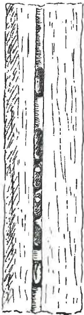
Fig. 2. — Nidification d' Osmia parvula D. et P. parasitée par Stelis ornatula KLUG. Seule la cellule inférieure n'a pas été parasitée. (Croquis effectué après la sortie des adultes).

13. — Anthidium manicatum F. — Tous les étés de 1936, 1937, 1938 et 1939 se sont passés sans nous permettre de trouver une seule Anthidie, à Beyne. Depuis 1940, de nombreux exemplaires viennent butiner dans notre jardin, attirés sans doute par le grand nombre des plantes mellifères (surtout Labiées) qui y ont été introduites. Ils apparaissent dès le début de juillet pour butiner surtout Stachys (Betonica) officinalis TREV., Nepeta cataria L. et Anchusa officinalis L., ensuite Marrubium vulgare L. et Linaria cymbalaria L., puis, mais exceptionnellement, Antirrhinum orontium L., Verbascum thapsus L., Saponaria cathartica L. et peut-être Digitalis purpurea L.