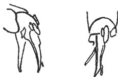
Fig. 4. — Edéage d' Autoserica gabonica BRENSKE.

Le couple type est dans la collection du Musée. Les étiquettes portent Galam et non Gabon comme l'avait lu BRENSKE; la provenance doit donc être corrigée dans les catalogues.