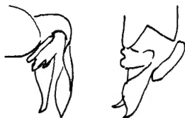
Fig. 5. — Edéage d' Autoserica Tinanti n. sp.

Se rapproche de gabonica BRENSKE, le dimorphisme abdominal plus accentué, le flabellum antennaire du ♂ moins courbé, l'édéage (fig. 5 et 5') bien distinct, quoique d'un type assez