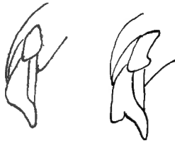
Fig. 5' (à gauche). Edéage d' Autoserica Tinanti n. sp. et 6 (à droite) d' Autoserica Tinanti Wittei n. var.

Pronotum ayant les côtés légèrement convergents, en ligne droite de la base jusqu'au delà du milieu, puis rétrécis en courbe; angle antérieur avancé; apex droit, angle postérieur droit, légèrement arrondi au sommet; base avancée en arc au milieu, ses côtés droits, une légère dépression au commencement de la partie en arc; une file de crins à l'avant et sur les côtés, d'autres en dessous du rebord latéral; il n'y a pas la très légère sinuosité des côtés qu'on voit avant la base chez gabonica ; ponctuation en points ombiliqués assez abondante. Ecusson en triangle à côtés courbes, ponctué sauf sur une ligne médiane.