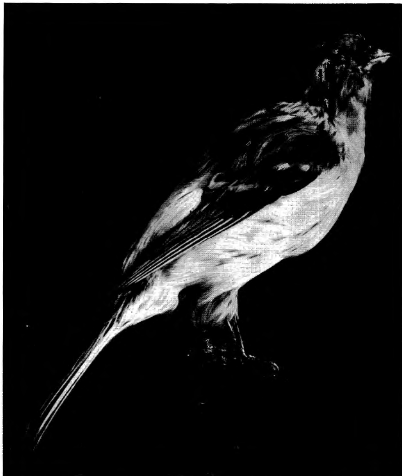
Acanthis flammea hornemanni (Holböll) capturé à Herenthals (Anvers), le 10 octobre 1937 Grandeur naturelle.