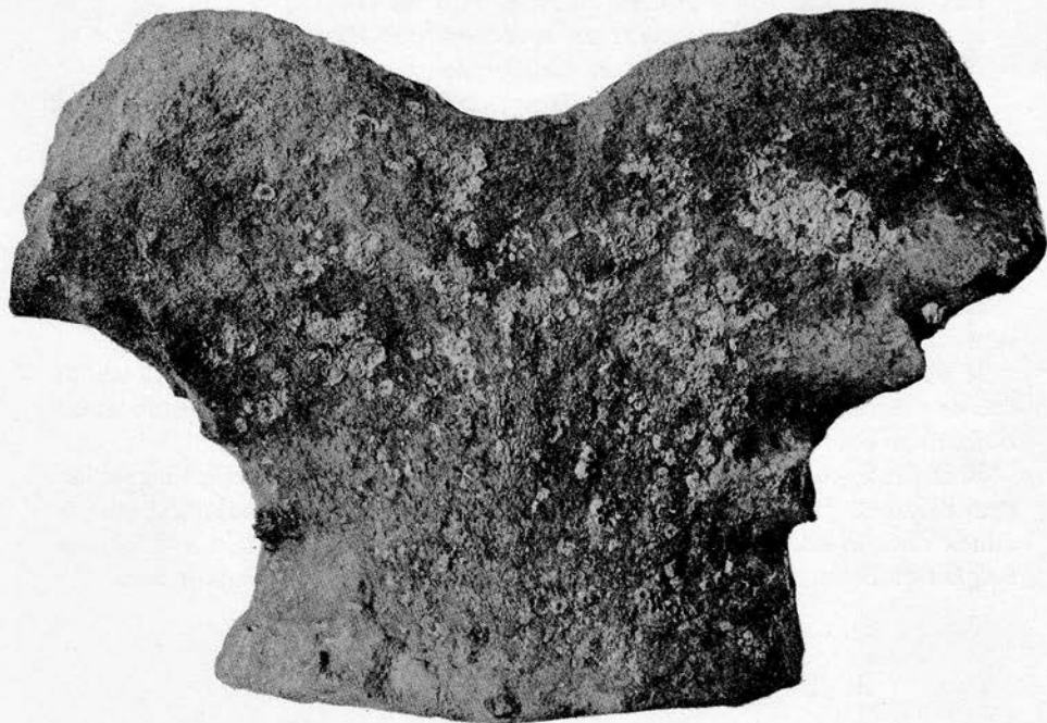
Fig. 1. — Balaena belgica , les sept vertèbres cervicales.

Cette disposition est due au fait que le trou occipital, ainsi que les deux condyles ont glissé plus fortement vers la partie mésiale de la base du crâne chez les Balaenidés que chez les Balaenoptéridés.