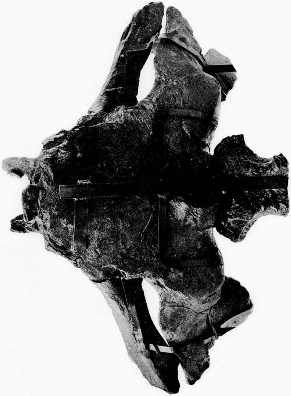
Balaena belgica : crâne, face dorsale.

F. PLISNIER-LADAME et G. E. QUINET. — Balaena belgica ABEL 1938, Cétacé du Merxemien d'Anvers.