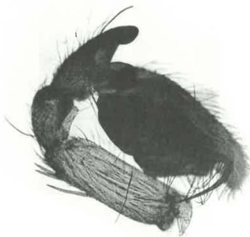
Fig. C. — Clubiona frutetorum L. KOCH.