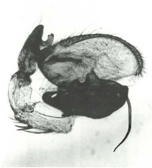
Fig. A-B. — Clubiona similis L. KOCH.