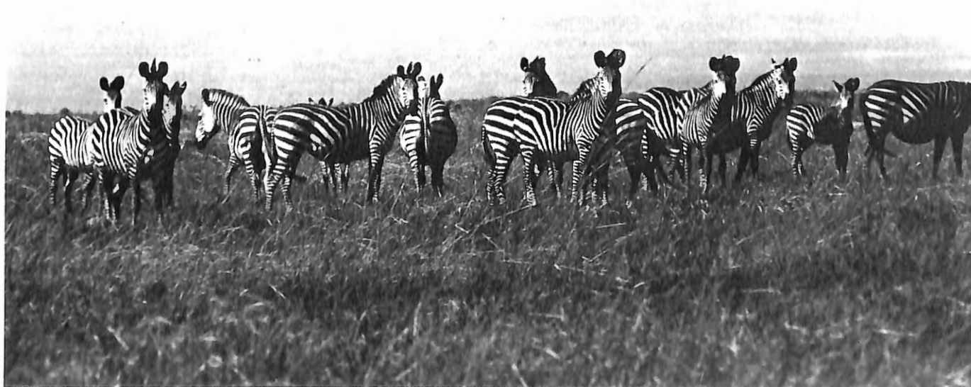
Photo 4. Parc National de l'Upemba, Zaïre. Zèbres sur le haut-plateau.