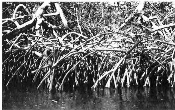
Photo 9. Parc National des Mangroves, Zaïre. Tiges-racines des palétuviers.

Ajoutons enfin que le Zaïre dispose d'un nombre important de réserves partielles, de domaines de chasse et de réserves forestières. La prospection mammalogique n'y a pas encore été entreprise; toutefois des données utiles pourraient être trouvées en compilant les travaux de SCHOUTEDEN. La réserve complexe de la Bili-Uere, dans la région d'Ango-Gwane, au nord du Zaïre est la plus importante du pays. Il s'agit de la seule région du Zaïre où subsiste encore l'Eland géant, Taurotragus derbianus . Sa présence y a été notée avec certitude en 1972-1973. Les Eléphants, Loxodonta africana , abondants en 1973, lors