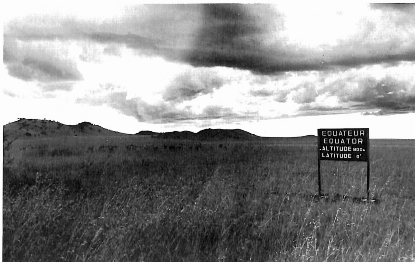
Photo 2. Parc National des Virunga, Zaïre. Secteur Nord, Monts Bukuku.