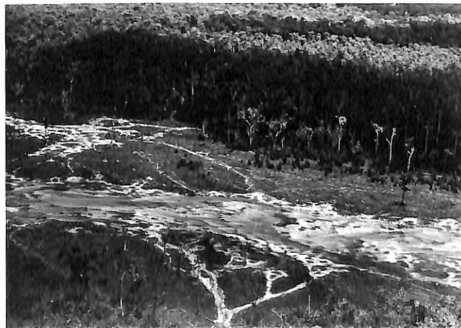
Photo 7. Parc National de la Salonga, Zaïre. Vue aérienne d'une clairière créée par les éléphants en forêt dense équatoriale.