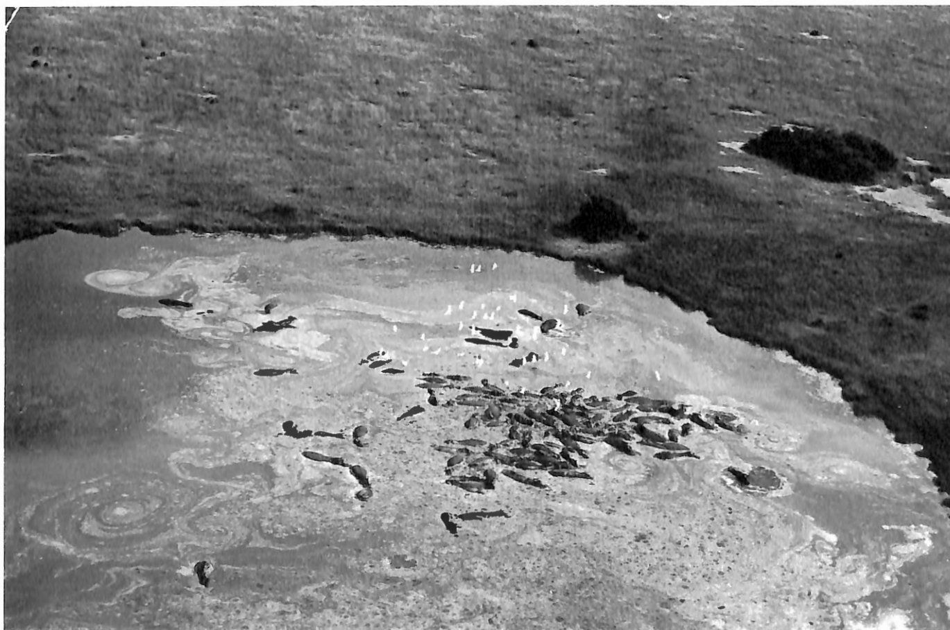
Photo 3. Parc National des Virunga, Zaïre. Les concentrations d'Hippopotames (ici photo aérienne) sont les plus élevées d'Afrique.