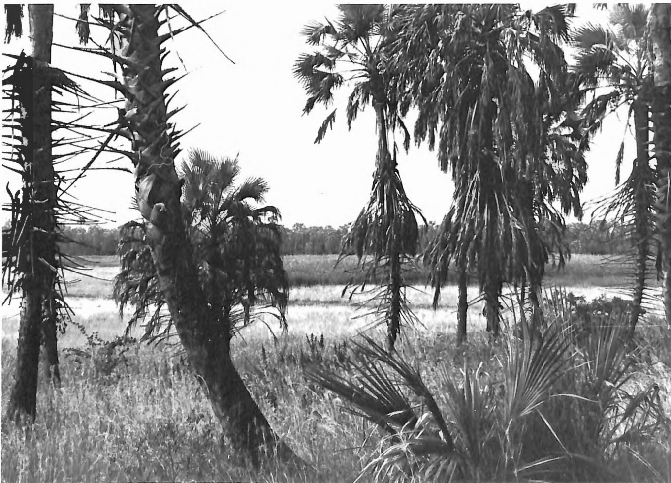
Photo 11. Burundi. Aspect typique du delta de la Rusizi. Forêt à Palmiers, Hyphaene benguellensis ventricosa .

Le Parc national de Kibira constitue la continuation, en territoire du Burundi, de la forêt de Nyungwe au Rwanda. On y trouve la faune typique des forêts d'altitude au niveau de l'Equateur. Le Gorille n'y existe certainement plus. Le Chimpanzé, Pan troglodytes , et Cercopithecus mitis s'y maintiennent, de même que quelques Eléphants, Loxodonta africana et plusieurs espèces de petits Cephalophus .