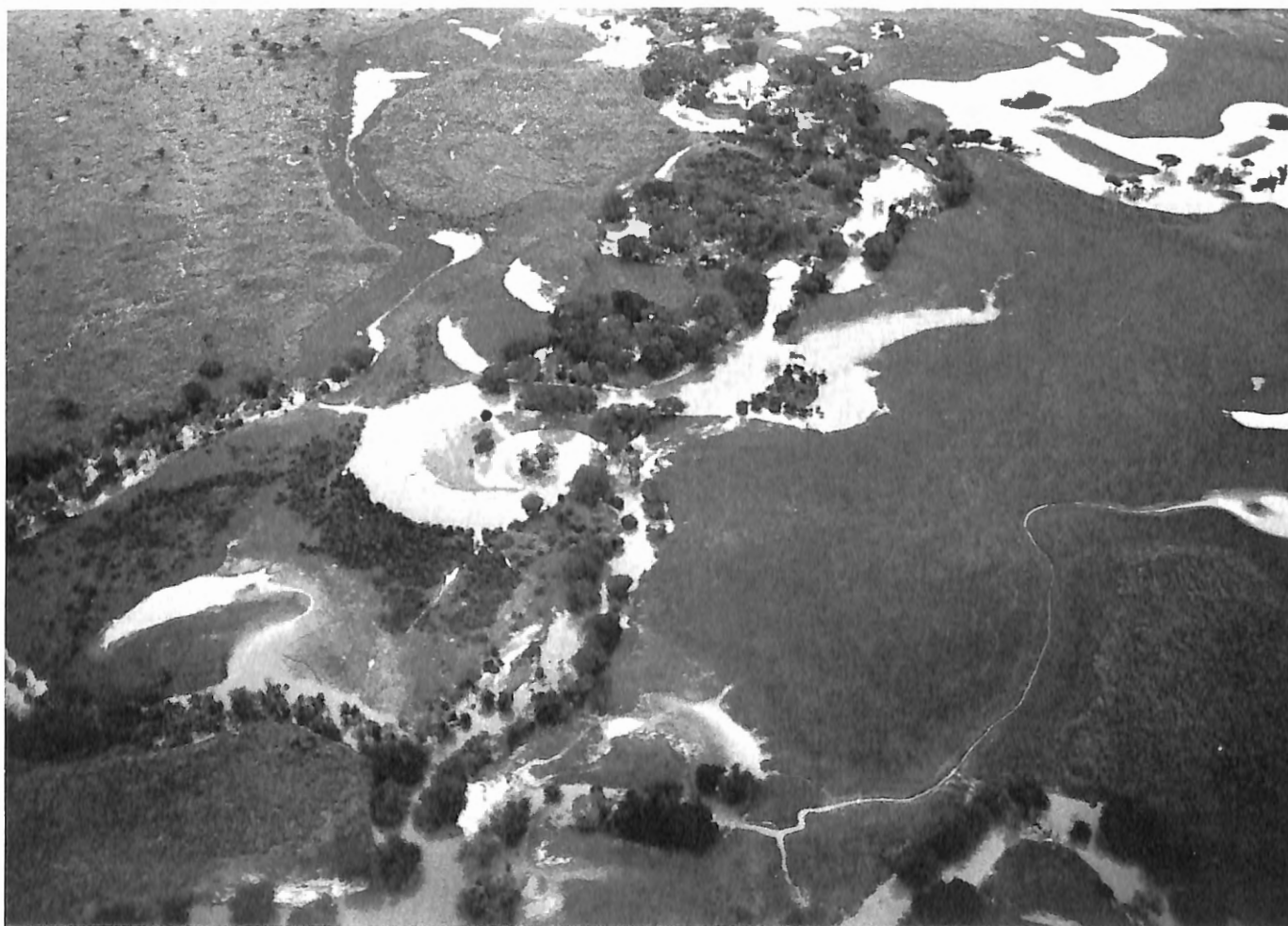
Photo 6. Parc National de la Garamba, Zaïre. Vue aérienne de la vallée de la Garamba, à la fin de la période des crues.