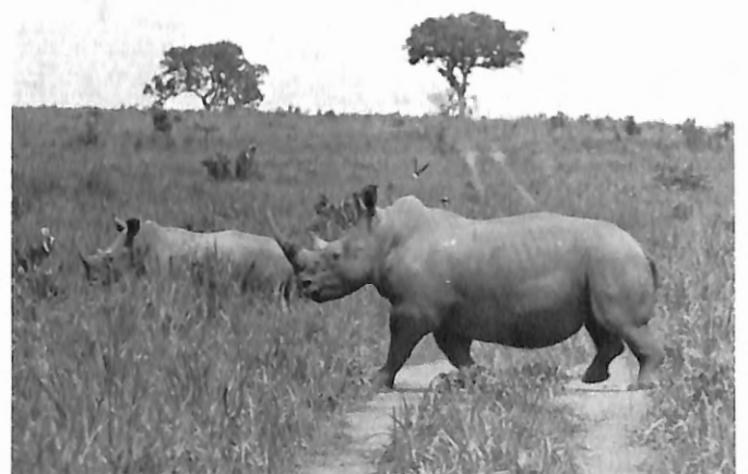
Photo 5. Parc National de la Garamba, Zaïre. Le Rhinocéros blanc du Nord, animal le plus rare de la planète.