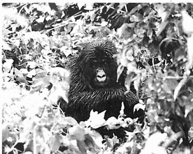
Photo 8. Parc National du Kahuzi-Biega, Zaïre. Gorille de l'Est.