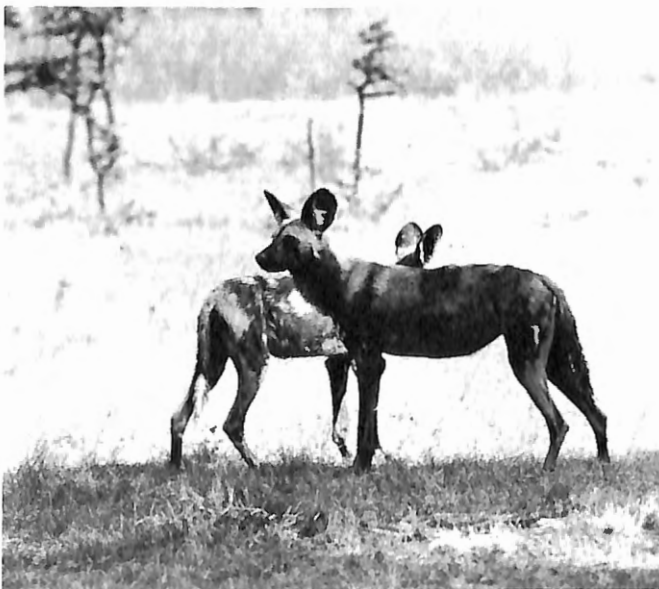
Photo 10. Parc National de l'Akagera, Rwanda. Lycaons.