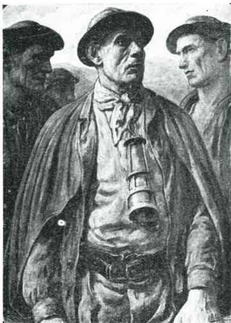
A.-L. MARTIN — Mineur à la lampe. (Belgique)

Une partie de l'Exposition est consacrée à l'Amérique d'avant Colomb. Elle présente quelques uns des rares objets qui soient parvenus jusqu'à nous, avec des documents de l'époque. Les conquérants cupides et bornés transformèrent en lingots de métal la plupart des richesses et vestiges incas, aztèques, chibchas ou autres. Cette transformation n'eut qu'un seul résultat heureux : elle contribua, par l'afflux de métaux précieux, à l'épanouissement de la Renaissance.