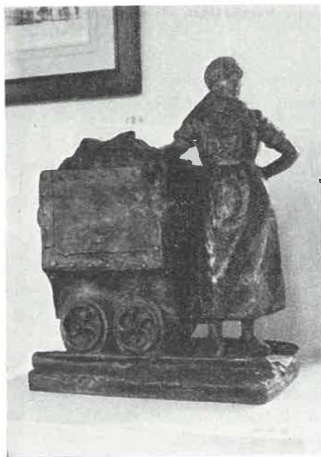
G. PETIT — Hiercheuse au wagonnet. (Belgique)

Toutes ces œuvres assemblées qui couvrent cinquante siècles d'activité de l'industrie minérale, appellent la méditation et la réflexion. Quoiqu'on puisse dire, écrire ou filmer pour critiquer nos temps modernes, le bilan de toute cette activité humaine est positif.