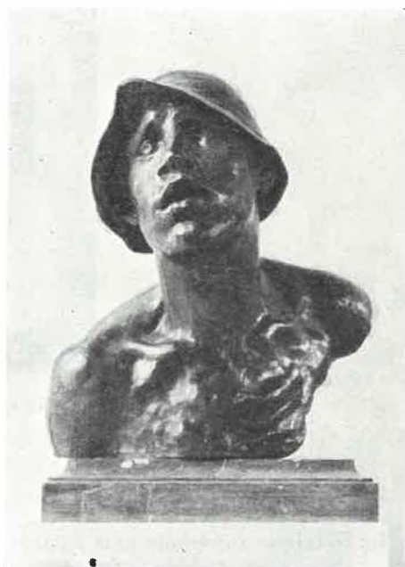
Constantin MEUNIER — Tête de puddleur. (Belgique)

Les contemporains vivants sont enfin largement représentés par des artistes de nationalités diverses, dont les œuvres forment un témoignage vivant du temps présent, de l'activité dans nos mines et dans nos usines — œuvres de nature et de style variables selon que l'artiste cherche plus ou moins à imposer son tempérament et son style personnel.