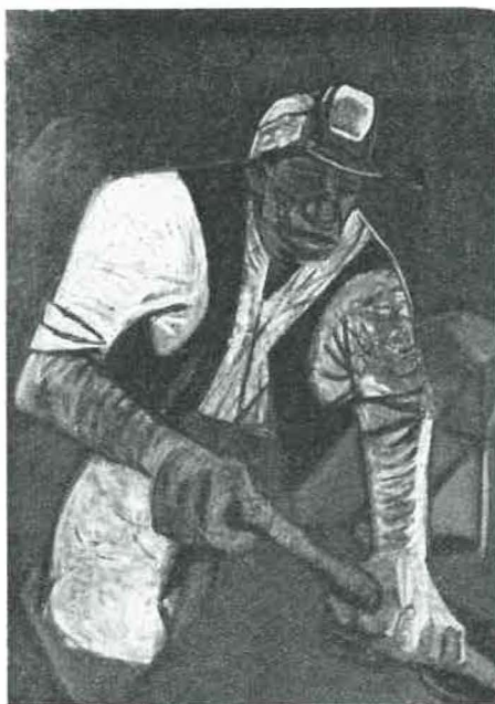
M. ZULAWSKY — Mineur au travail. (U. S. A.)

Comme il est dit à la rubrique « Communiqués », in fine de cette publication, la Société de l'Industrie Minérale publie, par souscription, un ouvrage d'art, format 28 × 38 cm. L'ouvrage comporte une préface et des planches amovibles portant un minimum de seize reproductions en couleurs et de quarante à cinquante reproductions en noir et blanc des œuvres d'art les plus caractéristiques qui ont été exposées.