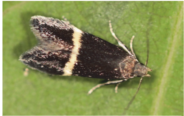
Fig. 1. Syncopacma ochrofasciella (Toll, 1936), imago ex-larva. Belgique, province de Namur, Vierves-sur-Viroin, 08.VII.2014 (Photo: Stéphane Claerebout).

Alors que l'identification spécifique sur base des colorations alaires est souvent douteuse, les structures génitales au sein du genre Syncopacma la permettent sans ambiguïté. Chez les genitalia mâles, la forme des valves et, chez la femelle (Fig. 2), la forme du sterigma et des apophyses sont diagnostiques. Ces structures sont bien illustrées par ELSNER et al. (1999), BUCHNER (2004) et RODELAND (2013). Parmi toutes les espèces de Syncopacma , seul S. ochrofasciella possède sur le bord de ses valves deux projections dirigées postérieurement, ce qui en fait l'espèce du genre la plus facile à identifier.