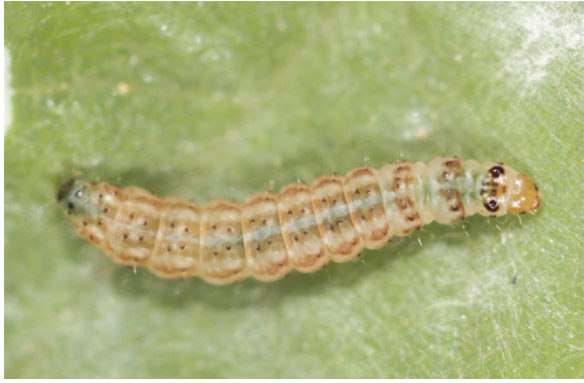
Fig. 3. Syncopacma ochrofasciella (Toll, 1936), chenille. Belgique, province de Namur, Vierves-sur-Viroin, 16.VI.2014.