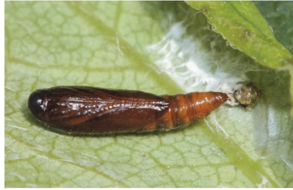
Fig. 4. Syncopacma ochrofasciella (Toll, 1936), chrysalide. Belgique, province de Namur, Vierves-sur-Viroin, 24.VI.2014.

Le stade larvaire de nombreuses espèces de Gelechiidae reste encore inconnu et le genre Syncopacma n'échappe pas à la règle.