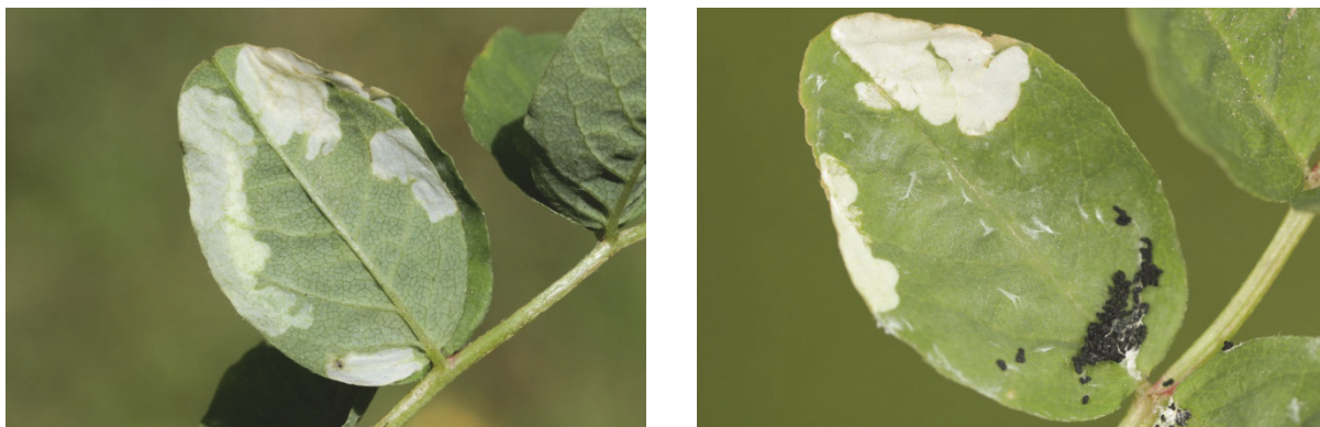
Fig. 5. Syncopacma ochrofasciella (Toll, 1936), mines sur Astragalus glycyphyllos . Belgique, province de Namur, Vierves-sur-Viroin, 16.VI.2014.

Chez de nombreuses espèces appartenant au genre Syncopacma , les larves sont connues pour être mineuses (Fig. 5). Leurs plantes hôtes font toutes partie de la même famille botanique, les Fabacées. La seule plante hôte renseignée pour S. ochrofasciella est la réglisse sauvage ou astragale à feuilles de réglisse ( Astragalus glycyphyllos ) (ELSNER et al. , 1999; BARAN, 2013), plante typique de l'ourlet mésophile calcicole. L'indication de G. Krumm selon laquelle le baguenaudier ( Colutea arborescens ) est également une plante hôte est intéressante et mériterait d'être confirmée par de nouvelles observations (RODELAND, 2013).